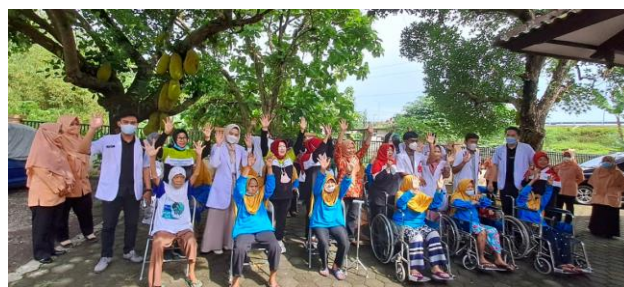
Gambar 1. Penyampaian materi dan praktek PHBS

Warga di Panti Wredha Harapan Ibu sangat antusias dengan kegiatan yang dilaksanakan. Kondisi positif ini menjadi awal yang baik untuk memberikan penyuluhan tentang manfaat PHBS dalam menghadapi pandemi Covid-19 dan pengisian kuesioner tentang manfaat dan cara melaksanakan PHBS. Kegiatan ini dilaksanakan dengan harapan warga di Panti Wredha Harapan Ibu dapat mengetahui bahwa menjaga PHBS adalah cara menjaga kesehatan masyarakat yang dapat dilakukan oleh seluruh lapisan masyarakat dalam rangka pencegahan penularan Covid-19.