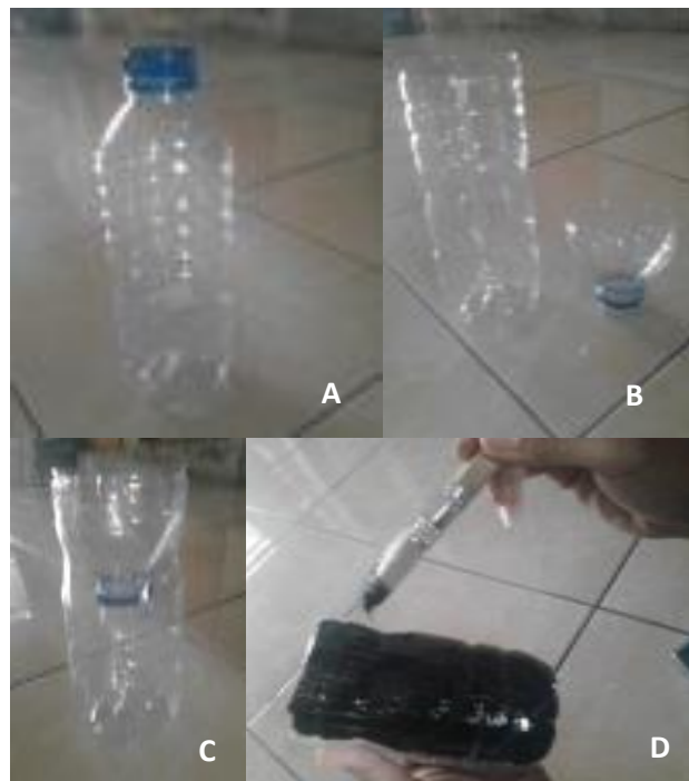
Gambar 1. Pembuatan ovitrap

Alat dan Bahan yang dibutuhkan diantaranya adalah botol bekas kemasan air minum 1500 ml, cat hitam atau lakban hitam, gula pasir, ragi, gunting dan air. Adapun langkah pembuatan ovitrap dimulai dengan memotong botol di dua per tiga bagian atas, lalu memasangnya kembali bagian tutup dengan posisi terbalik. Agar tidak mudah lepas dapat direkatkan dengan bahan perekat atau menggunakan isolasi. Selanjutnya botol yang telah dimodifikasi tersebut dicat berwarna hitam.