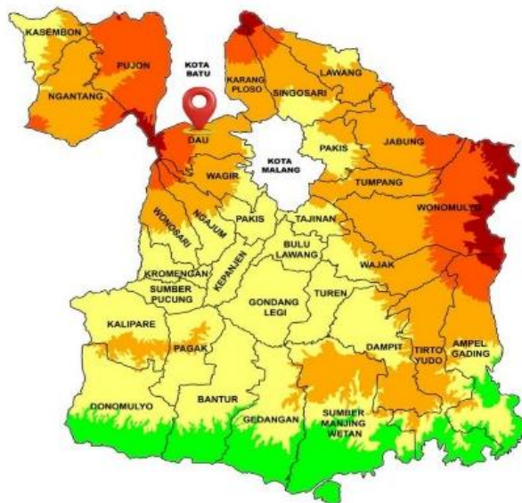
Gambar 1. Lokasi Penyuluhan di Kabupaten Malang.

Non-Tuberculous Mycobacteria (NTM) dapat menyebabkan penyakit serius pada manusia dan hewan, terutama pada orang dengan gangguan imunitas atau hewan dengan kondisi kesehatan yang lemah, meskipun itu oportunistik. Infeksi NTM pada sapi perah biasanya bersifat subklinis, tetapi dapat menyebabkan efek seperti penurunan berat badan, limfadenitis mesenterika, diare kronis, dan penurunan produksi susu (Rathnaiah et al. , 2017; Yu et al. , 2022). Selain itu, beberapa spesies NTM, seperti M. avium subsp. hominissuis dan M. fortuitum , dapat menyulitkan diagnosis tuberkulosis sapi dengan memberikan hasil uji tuberkulin yang salah (Gómez-Buendía et al. , 2022). Kondisi ini berdampak langsung pada ekonomi dan produktivitas peternak.