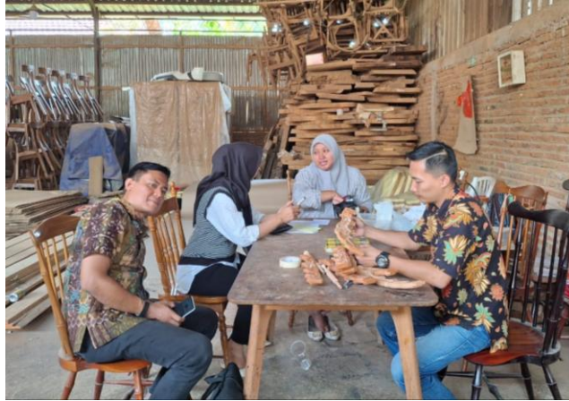
Gambar 3. Kegiatan Sosialisasi Kegiatan ke Mitra I-Design Furniture

Pelaksanaan kegiatan pengabdian ini sesuai dengan tahapan pengabdian Gambar 2 yang dimulai dari kegiatan sosialisasi yaitu tim melakukan kunjungan ke mitra menjelaskan program kegiatan yang akan dilaksanakan dengan mitra.