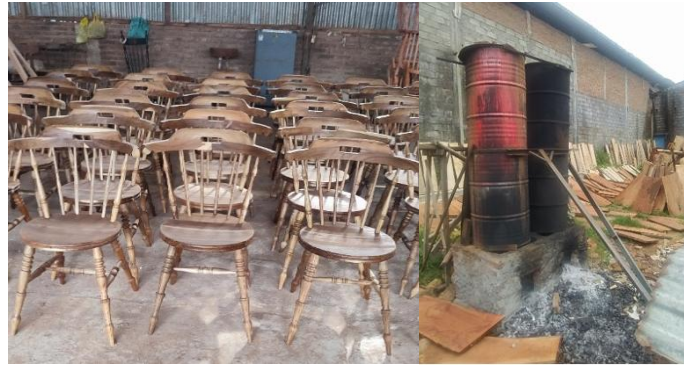
Gambar 1. Produk Mitra kursi lengkung (kanan), media merebus kayu dengan cara manual (kiri)

Pada kegiatan pengabdian ini tim mengusulkan perancangan alat steam bending yang diintegrasikan dengan Internet of Things sehingga bisa dikontrol suhu dan kelembapan. Metode yang digunakan dalam pelaksanaan kegiatan ini melalui sosialisasi, pelatihan, dan pendampingan. Tujuan dari kegiatan ini adalah