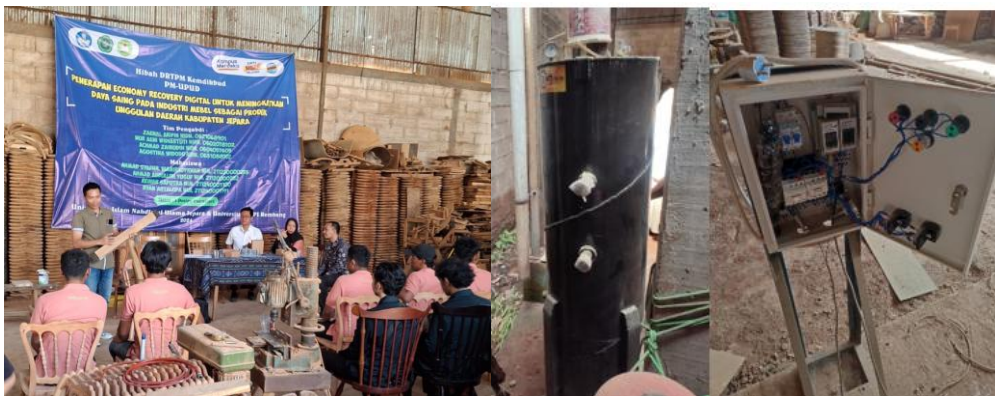
Gambar 4. Pelatihan Steam dan alat steam beserta control panel

Kegiatan sosialisasi dilaksanakan pada tanggal 10 Juli 2025. Pada kegiatan ini tim menjelaskan terkait teknis pelatihan steam kayu mulai dari cara pemilihan bahan, cara pengoperasian alat steam dan praktek dengan karyawan yang ditunjuk untuk mengontrol alat tersebut.