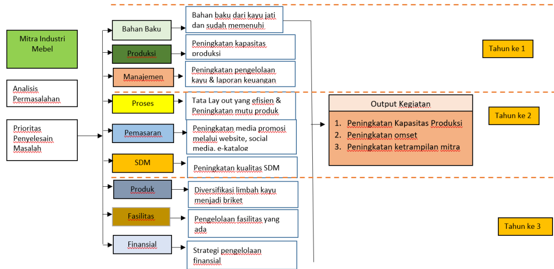
Gambar 2. Tahapan Pelaksanaan Kegiatan Pengabdian

Kegiatan pengabdian dilaksanakan selama 8 bulan. Berikut tahapan pelaksanaannya: