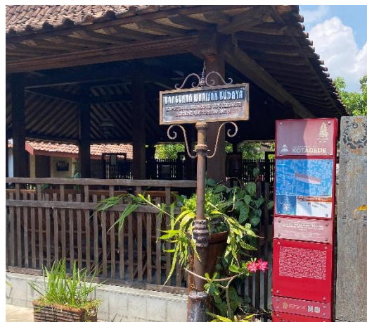
Gambar 2: Bangunan warisan budaya

sebagai bentuk inovasi dari konsep desa wisata yang lebih mengedepankan identitas budaya, kearifan lokal, serta potensi lingkungan perkotaan maupun perdesaan [8]. Berdasarkan hasil observasi daya Tarik yang terdapat di kampung wisata purbayan ini bersifat heritage yang berfokus pada seni dan budaya serta Sejarah yang terkandung didalamnya. Menurut [8] kampung wisata budaya memang memiliki segmentasi peminat tersendiri karena kekhasan potensi tempat dan suasana yang ditawarkan. Berbeda dengan pariwisata pada umumnya yang menonjolkan aspek keindahan alam, hiburan kekinian, dan kuliner yang beraneka ragam, wisata seni budaya dan bersejarah justru berupaya menyuguhkan keotentikan dan nilai sebuah Sejarah yang unik dari objek-objek budaya yang sudah diwariskan dari waktu ke waktu. Kampung Wisata Purbayan memiliki potensi yang cukup besar dalam sektor pariwisata, antara lain sentra budaya, kesenian, dan adat-istiadat seperti seni budaya ketoprak, sendratari klasik dan koteporer, kuliner, pengrajin perak, dan upacara Nyadran. Dalam Kampung Purbayan juga terdapat beberapa situs bersejarah seperti petilasan pengeran Purboyo, Lawang Petuk, dan Rumah Prof. didalam kampung ini juga terdapat Masjid Nurul Huda yang menjadi pusat ilmu agama Islam di Kotagede dan ramai di kunjungi wisatawan [8].