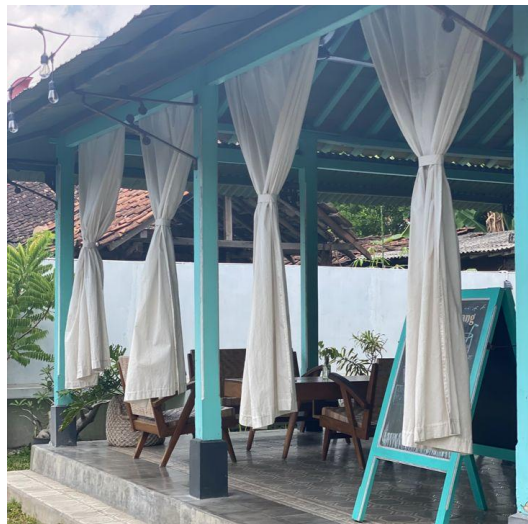
Gambar 4: Kafe

Warung dan kafe yang dikelola UMKM juga menjadi daya tarik tersendiri. Menurut [8], pelaku UMKM bukan hanya memasarkan souvenir , tetapi para pelaku UMKM yang ada di kelurahan Purbayan juga bergerak dibidang kuliner dan alat perlengkapan senipertunjukan. Berbagai produk kuliner khas seperti roti kembang waru, legamara, sehingga jajanan ukel-banjar disajikan oleh pelaku usaha kecil setempat. Tidak hanya berfungsi sebagai tempat yang memenuhi kebutuhan konsumsi, warung dan kafe di kampung wisata Purbayan juga merupakan media pelestarian kuliner tradisional serta sarana pemberdayaan ekonomi masyarakat setempat. Wisatawan yang singgah bisa mencicipi makanan khas sekaligus membawa pulang oleh-oleh, sehingga roda ekonomi lokal ikut berputar. Inilah bukti nyata bagaimana kampung wisata dapat menghubungkan pelestarian budaya dengan peningkatan kesejahteraan masyarakat.