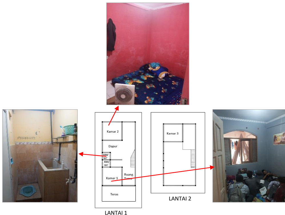
Gambar 1. Pengaruh sirkulasi terhadap ruang rumah

Kondisi rumah ini minim jendela dan ukuran kecil. Kurangnya ventilasi udara menyebabkan sirkulasi udara minim dan gerah, dikarenakan juga oleh kurangnya resapan air mengakibatkan lembab dalam ruangan (Gambar 1). Tata letak ruangan yang tidak sesuai aturan membuat rumah tidak ideal, mendesain secara asal-asalan yang penting sesuai keinginan pribadi, Desain rumah yang mengabaikan jalur sirkulasi udara berakibat fatal terhadap sirkulasi udara. Keberadaan bangunan rumah yang berhimpit dengan beberapa rumah-rumah warga dari kanan-kiri maupun belakang rumah. Terhimpitnya dengan bangunan lain mengakibatkan sulitnya pergerakan angin menuju ke dalam rumah. Sehingga membuat sirkulasi udara buruk, pengap, lembab, dan munculnya penyakit-penyakit.