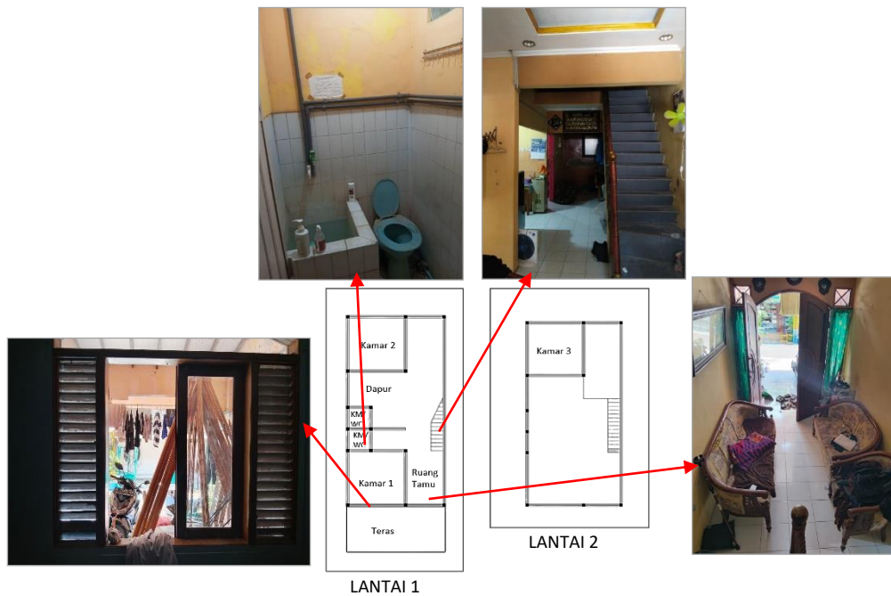
Gambar2. Pengaruh pencahayaan terhadap ruang rumah

Salah satu permasalahan pada rumah ini karena kurangnya jumlah jendela dan kecil, peletakan jendela yang berlawanan dengan arah cahaya, posisi bangunan tidak menghadap ke arah datangnya cahaya matahari yang mengakibatkan minim penchayaan, dan tentunya terhempit oleh beberapa bangunan di sekitarnya (Gambar 2). Hal ini bisa mempengaruhi kesehatan, pola hidup, bahkan perkembangan orang yang tinggal di rumah ini. Solusinya diperlukan pengetahuan/konsultasi jika ingin membangun/merenovasi rumah kepada yang ahli, penggunaan jendela diperbesar dan ditambah jumlahnya, perbaikan posisi jendela. apabila tidak memungkinkan maka perlu memasang skylight (atap transparan) untuk memasukan cahaya matahari.