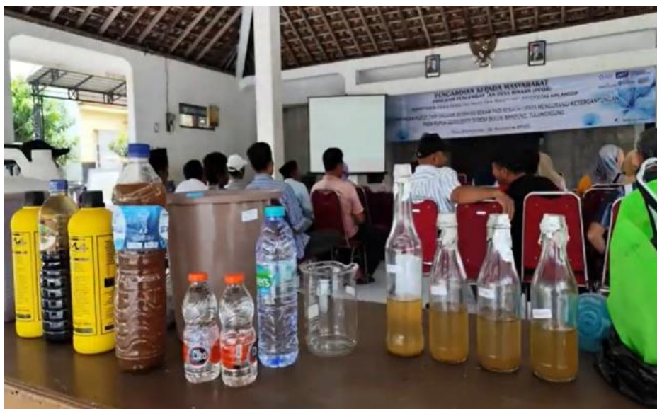
Gambar 3. Proses Pembuatan Pupuk Cair Organik dari Sekam Padi

Para peserta menunjukkan antusiasme yang tinggi selama mengikuti kegiatan pelatihan, terutama saat mendengarkan paparan materi yang disampaikan oleh para dosen dengan cara yang mudah dipahami, dilengkapi dengan gambar dan visualisasi menarik yang membuat suasana menjadi lebih hidup dan interaktif. Penyampaian materi yang komunikatif