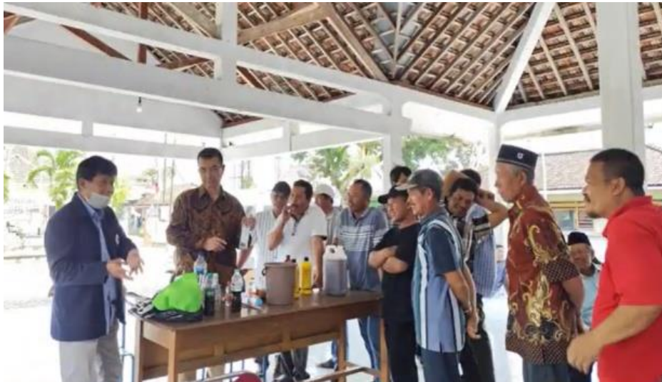
Gambar 2. Praktek Pembuatan Pupuk Cair Organik

Pelatihan diakhiri dengan sesi tutorial langsung tentang " Proses Pembuatan Pupuk Cair Organik dari Sekam Padi " yang dipandu oleh tim dosen (Gambar 2). Peserta diajak mengikuti langkah-langkah pembuatan pupuk secara praktis, mulai dari pembakaran sekam menjadi abu, pencampuran dengan bahan organik lain, proses fermentasi, hingga penyimpanan pupuk yang telah jadi. Kegiatan praktek ini memberikan pengalaman langsung kepada para petani, sehingga mereka tidak hanya memahami teori, tetapi juga mampu memproduksi pupuk sendiri secara mandiri. Pelatihan ini diharapkan menjadi langkah awal menuju kemandirian petani dan pengembangan pertanian organik di Desa Bulus.