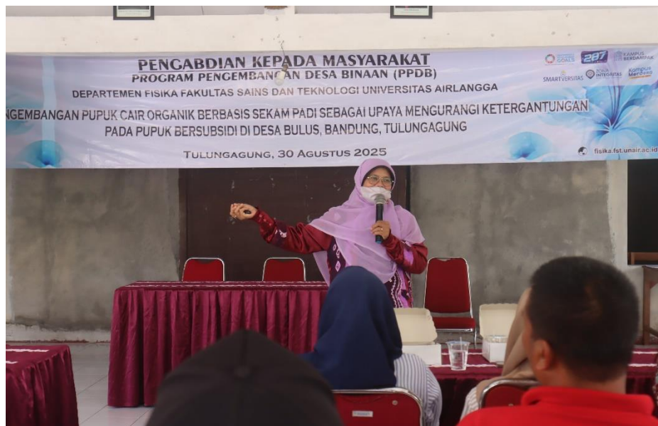
Gambar 1. Penyampaian materi Potensi Sekam Padi sebagai Bahan Baku Pupuk Cair Organik

Pelatihan pembuatan pupuk organik cair yang diselenggarakan di Desa Bulus menghadirkan para dosen dari Departemen Fisika Universitas Airlangga sebagai narasumber utama. Dengan mengusung tema " Menuju Desa Inovasi Tani Organik ," para dosen memberikan paparan tentang pentingnya inovasi di bidang pertanian organik sebagai solusi jangka panjang bagi kemandirian petani. Dalam sesi ini, peserta dikenalkan pada konsep pertanian berkelanjutan berbasis lokal, yang bertujuan tidak hanya meningkatkan produktivitas tetapi juga menjaga keseimbangan lingkungan.